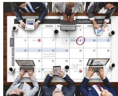
APEX Calendar of events

Dear colleagues, We are pleased to let you know that registration for the 2017 APEX Symposium (June 7-8) is now open! Our theme for 2017 is Celebrating Leadership Innovation and Diversity . The Symposium is a must attend event for federal executives - it is an ideal opportunity for us to network and learn from thought leaders across Canada on a variety of topics. Check out the program to review the calibre of speakers and content that we have secured.